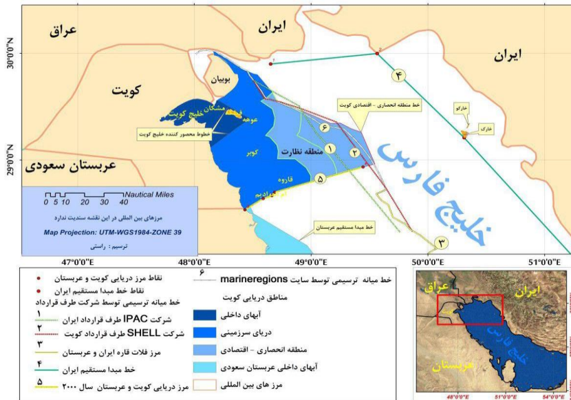
تصویر شماره ۲- نقشه قلمروسازی ادعایی کویت در خلیج فارس و عبور قلمروهای